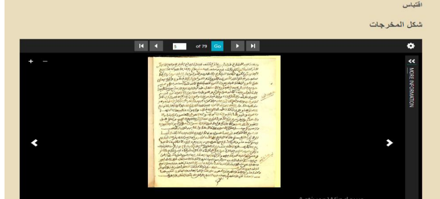
الصورة رقم 02: توضح جودة المخطوطات المرقمنة

بالحفاظ على الشكل الأصلي للمخطوط المرقمن، إضافة إلى وضوح محتوى المخطوط والصورة الموائية نموذج عن ذلك: