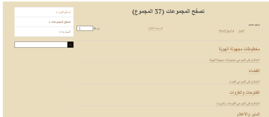
الصورة رقم 03: توضح تنوع مجالات المخطوطات المرقمنة

في هذا الإطار نجد أن معلمة المخطوطات والقائمين عليها قد أخذوا بعين الاعتبار جملة من النقاط لعل أبرزها رقمنة محتويات متنوعة في عدة مجالات وتم تقسيمها في مجموعات كما هو مبين في الصورة أدناه: