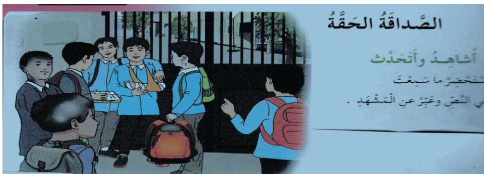
الصورة رقم(2): تمثّل المحور الأول (أشاهد وأتحدّث) من نص الصداقة الحقة.

ويمكن توضيح ذلك بمثال من النصّ الأول "الصدّاقة الحقّة" من المقطع الأول (القيم الإنسانية) فيما يلي 23 :