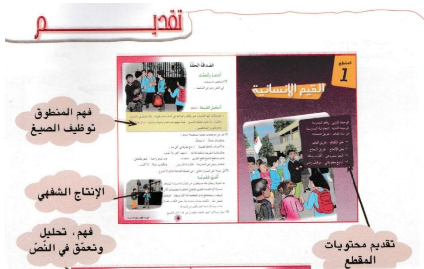
صورة رقم(1):تبيّن محتويات المقطع وميدان فهم المنطوق وإنتاجه.

النظر إليه نظرة كلية، تخاطبه من خلالها خطابا يتجاوز الطبيعة اللسانية للغة، إلى خطاب ينسجم مع طبيعة الطفل النفسية والإدراكية والمهارية 15 ورد بعد كلمة المؤلفين الموجهة للمتعلم مباشرة على اعتبار أن الكتاب معدّ له بالدرجة الأولى فهرس الكتاب في صفتين (ص.4،5)، الذي يتضمن ثمانية مقاطع تعلّمية «تعالج قضايا وموضوعات فكرية، وعلمية وثقافية»، 16 ووردت مرتبة على النحو الآتي: القيم الإنسانية، الحياة الاجتماعية والخدمات، الهوية الوطنية، التنمية المستدامة، الصحة والتغذية، عالم العلوم والاكتشافات، قصص وحكايات من التراث، الأسفار والرحلات. وتضمن كلّ مقطع من المقاطع الأنشطة الآتية: الأساليب، الرصيد اللغوي، القراءة، النحو، الصرف، الإملاء، المحفوظات، الإدماج (نص الإدماج+المشروع)+أوسع تعلماتي. ولم تتم الإشارة في هذا الفهرس إلى ميدان فهم المنطوق ونصوصه. يلي صفحتي الفهرس تقديم الكتاب الذي قدّم نماذج مصغرة عن الأنشطة اللغوية الواردة فيه مع محاولة توضيحها عبر استعمال الأسهم، كما هو موضّح في الصورة الآتية: 17