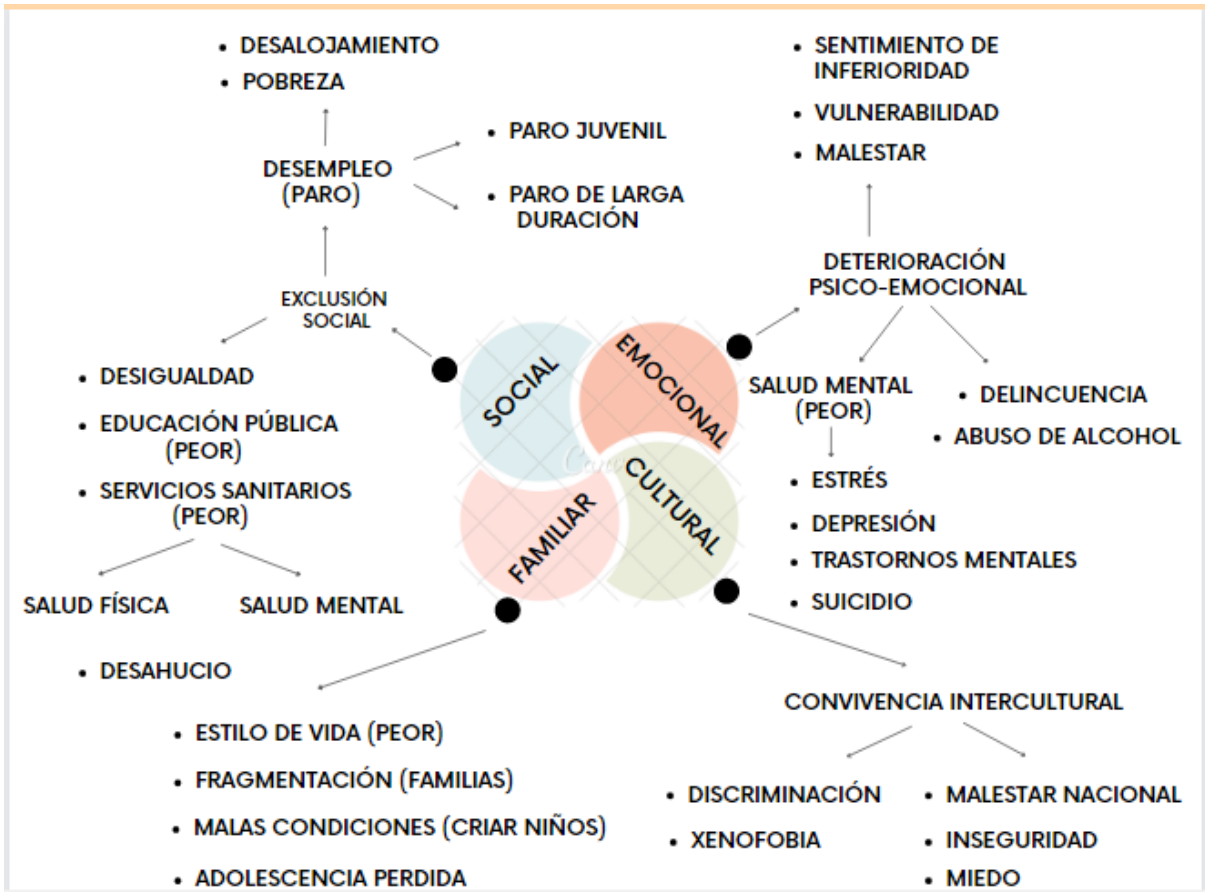
Esquema 2: Conceptualización de los efectos directos e indirectos de la crisis