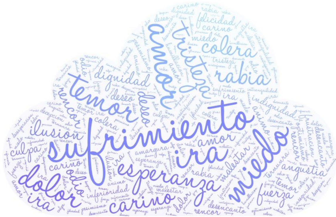
Figura 1: Nube de emociones de la novela de Los besos en el pan de Almudena Grandes