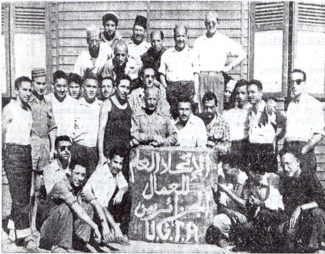
UN GROUPE DE MILITANTS ET DIRIGEANTS DE L.U.G.T.A. INTERNES AU CAMP DIT D'HEBERGEMENT DE SAINT-LEU