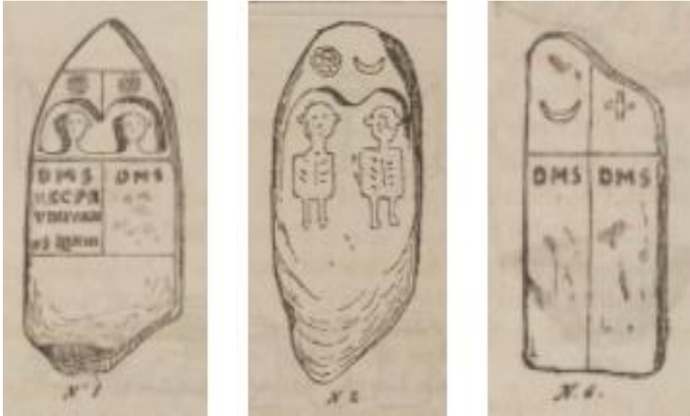
الصورة رقم 05 (Calmettes F., 1870, planche III)

الأكيد من خلال الكتابات الأثرية اللاتينية، أنها كانت تتضمن إهداء للآلهة الوثنية المعروفة باسم ماناس المقدسة من خلال عبارة (D. M. S)، التي تعد اختصارا لجملة Dis Manibus Sacrum ، وهذه الآلهة تخص آلهة الأرواح المقدسة عند الرومان في الفتره القديمه، والتي كانت تعرف باسم Mânes (Mommsen Th. & Marquardt J., 1885. P.148)، كما تحدث الباحث Reboud عن وجود معبد صغير بمنطقة عين تحميمين دون تحديد موقعه أو وصفه (Reboud V., 1883.p. 104)، وهو نفس الشيء بمنطقة كدية البطوم بمشته الرصفة، ونجد أن هذه المناقشات الجنائزية جمعت بين الطابع المحلي للآلهة والأجنبي، حسب ما هو ظاهر من الكتابة والرموز التي احتوتها.