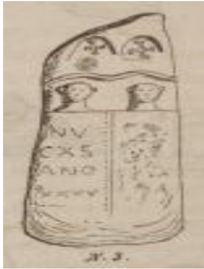
الصورة رقم 06 (Calmettes F., 1870, planche III)

الشيء الأكيد والثابت أن سكان ومواطني الفضاءات الريفية بمجاز الصفاء أثناء الفترة القديمة، قد اعتنقوا الديانة المسيحية (JAUBERT H., 1913, p149) كباقي سكان المناطق المجاورة، خاصة إذا علمنا أن المنطقة محل الدراسة، تتوسط ثلاثة مناطق هامة في تاريخ المسيحية في الفترة القديمة، وهي من أهم المستعمرات الرومانية في شمال إفريقيا، مستعمرة Thagaste وكذلك مستعمرة Hippo Regius، التي كان أسقفا بها وكانت مركزا له للعبادة والعلم والدعوة للمسيحية، ومدينة Titiana التابعة لمستعمرة Thubursicum Numidarum والتي شهدت مناظرة هامة، تحت إشراف القديس Augustinus بين الدوناتيين والكاثوليك في المسألة المتعلقة بالتوحيد (Mercier E., 1888. P. 123)، وقد وجدنا من خلال البحث البيبليوغرافي حول المنطقة كتابة أثرية مسيحية، غير واضحة وغير مفهومة (Gsell St., 1922, p.12).