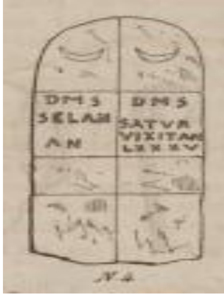
الصورة رقم 02 (Calmettes F., 1870, planche III)