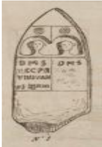
الصورة 04 (Calmettes F., 1870, planche III)

ومن خلال الكتابات الأثريه اللاتينيه التي عثر عليها بموقع كوديت البطوم التابع لمشته الرصفه، اتضح نوعا ما صوره المجتمع بهذه المنطقه (Calmettes F., 1870, P.195 et planche III)، وخاصه تواجد العنصر الأجنبي بالمنطقه، فقد أمدتنا نقيشه كديه البطوم التي تتكون من سجلين باسم وكنيه لاتينيه، وهو كيسيلىوس بريموس، الذي عاش 78 سنه.