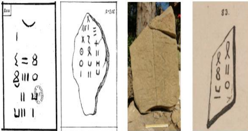
الصورة رقم 01.

بالرجوع إلى الكتابات الأثرية الليبية (Faidherbe, 1873, p.p.64-65) التي عثر عليها بالموقع الأثري عين تحميمين إلى جانب الكتابات الأثرية اللاتينية التي تم العثور عليها في الموقع الأثري كدية البطوم (Gsell St., 1922, p.12)، تأكد لنا تواجد العنصر المحلي بمنطقة مجاز الصفاء، إلا أنه بالاعتماد على هذه الكتابات الأثرية وحدها، لا يمكننا التعرف على العنصر المحلي الذي سكن المنطقة وأصوله، نتيجة لتعدد القبائل والأعراق في الشمال الإفريقي، وخاصة بالنسبة للكتابات الأثرية الليبية (الصورة رقم 01) لعدم معرفتنا محتوى هذه الكتابة، نتيجة لبرتها وعدم وضوح حروفها، بالإضافة إلى عدم القدرة على دراستها لغويا لانعدام المختصين في هذا المجال، وهناك من سعى إلى دراسة اللغة الليبية من خلال اللغة البونية، إلا أنه إلى حد الساعة لا توجد أي دراسة علمية موضوعية لدراسة الكتابات الليبية، نتيجة لاندثار اللغة الليبية في وقت جد مبكر، أين خلفتها التيفيناغ والبونية.