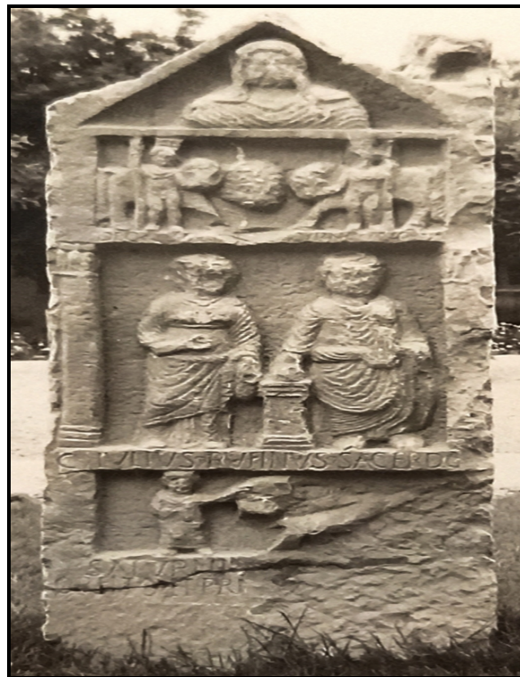
Photothèque CCJ, cliché n° 100393, pris P.-A. Février, 1962.