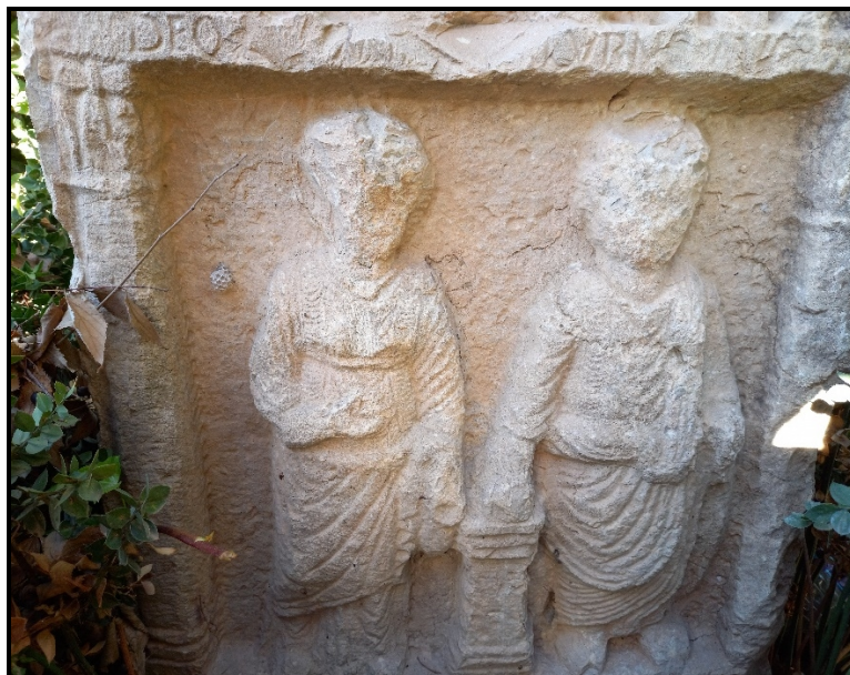
Cliché A. Boudier et S. Annane, janvier 2022.