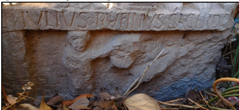
Cliché A. Boudier et S. Annane, janvier 2022.