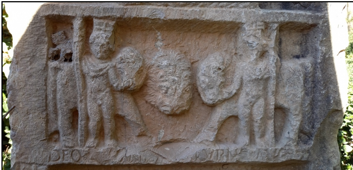
Figure 4 : détail du deuxième registre de la stèle de Zarai , CIL VIII ,

Cliché A. Boudier et S. Annane, janvier 2022.