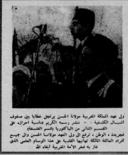
ول بعد الملكة المغربية مولانا الحسن يرتحل تلقيا بين صفوف انبياس الكفيلة - نشر رسمه التكرم بتبسيه اعزازهم على الجريدة - الوطن - ابراج ال دل الجيده مولانا الحسن وال جميع افراد العائلة الكريمة انماها الكفيلة على هذا المراسم العظمى الذي فاز به لعر الامة المغربية ابداه

كان نشاط نواب حزب البيان في فرنسا واصلهم بالهبات الديمقراطية والارباب السياسية و تصور الرأي العام الفرنسي بحقيقة في طيحهما الاستبداديين الاخيرة التي طيحهما لكن هذا التمسك في التمسك على بعض الاموال الفرنسي التي سفلوا فيها على ايرتال فئة تحقيق لفظ الجزائريين تمتع في التمسك التي تمتع حزب البيان باسم الشعب الجزائري ضد الاستبداد الفرنسي الذي ضرب الركن السياسي في تاليوس الاتحاد و وقد تم بحسب الاتحاد الاضاحه التي تمركز عنهم الحبيسة التي تسفل في الجزائر في الغرب.