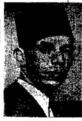
الزعيم جمال عبد الناصر