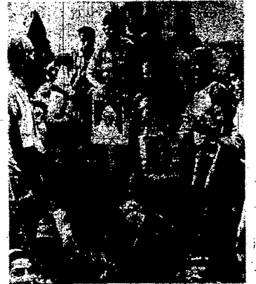
معلق البيان المغربي يتكلمون قدامهم في مظاهرة نقل انا يشع المبالغين وياهم موزة السلطان محمد بن سوس

لم تتوقف الاضطرابات الثورات لزعيم اركانها الواديه من حل الصواب التي التام الاستدري واردة الت تواجها الحكومة الفرنسية ولا تزان التناجات التنازل