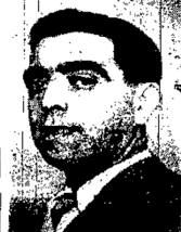
جمال عبد الناصر نائب الرئيس