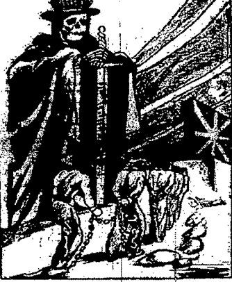
نقلت هذه الصورة عن جريدة الجماهير المصرية. وهي ترمز إلى التسور القوية على الاستعمار الأكلوسكسوني والتابعة لحكم هذه القيود.

يحضن التصنيع الآلة التي وصلتنا عن إيطاليات وإلمعات وتعمل على مقدار تعجز فرنسا في القرية... (البقية على الصفحة 3)