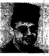
جمال عبد الناصر نائب الرئيس