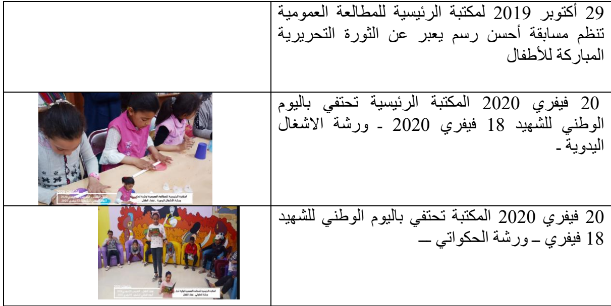
الجدول (2) اهم نشاطات مكتبة الأطفال 15

بالإضافة الى هذه النشاطات الدورية التي تقوم بها المكتبة لفئة الأطفال فإنها تقوم ببرمجة نشاطات عديدة أخرى تتماشى و الاحداث الوطنية و المحلية من بينها :