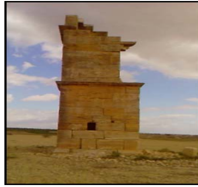
ضريح قصر الأحمر