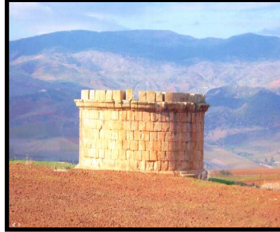
ضريح عائلة لوليوس Lollius