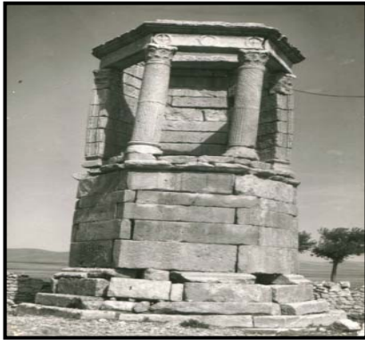
ضريح صومعة الجازية