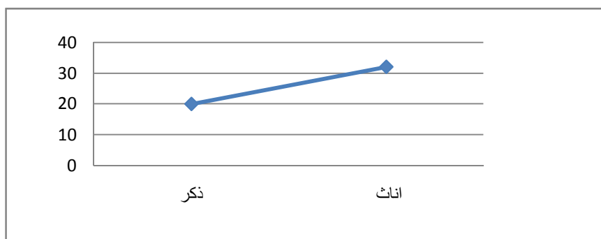
الشكل 1: يبين مواصفات العينة حسب الجنس (شعبة آداب)

تم اختيار عينة البحث من تلاميذ السنة الثانية ثانوي بالمرحلة الثانوية من شعبة الآداب و اللغات الأجنبية وشعبة العلوم التجريبية، وتم الاختيار بالطريقة قصدية. حيث تكونت عينة البحث في دراستنا هذه من 104 تلميذ وتلميذة (52 من شعبة الآداب و52 من شعبة العلوم) ويقعون في الفئة العمرية بين (15 سنة و20 سنة) وفيما يلي مواصفات العينة حسب الجنس: